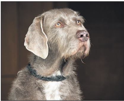
Slowakischer Drahthaariger Vorstehhund.