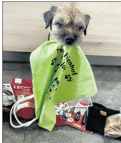
Jeder Hund erhielt eine Tasche voll mit Leckereien.